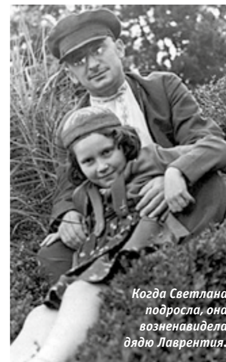
Когда Светлана подросла, она возненавидела дядю Лаврентия.

Интересно, что за несколько лет до этого пытался застрелиться старший сын вождя (от первого брака) Яков, которым отец вечно был недоволен. Но пуля прошла навылет. «Ха, не попал!» — посмеивался над ним Сталин. Вероятно, эта история тоже подействовала на Надежду. «Смерть мамы страшно ударила его (отца. — Прим. В. Ч.), опустошила, унесла у него веру в людей и в друзей. Он всегда считал маму своим ближайшим и верным другом, — смерть ее он воспринял как предательство, как удар ему в спину. И он ожесточился. Должно быть, общение с близкими было для него каждый раз тяжким напоминанием о ней. И он стал