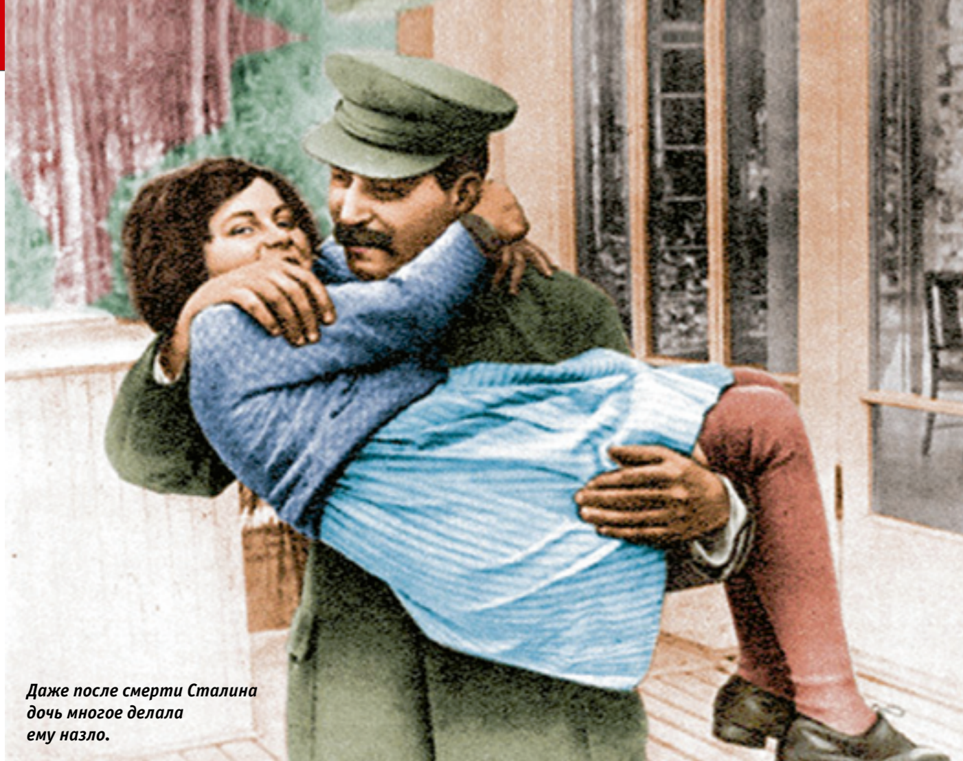
Даже после смерти Сталина дочь многое делала ему назло.