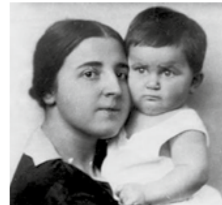
Надежда Аллилуева воспитывала дочь в строгости.

Берии. Но, возможно, она объясняется сугубо личными мотивами. Первой любовью 14-летней Светланы стал сын Берии — 16-летний Серго. Но он не ответил взаимностью дочери Сталина, а стал ухаживать за ее одноклассницей Марфой Пешковой, внучкой Максима Горького, на которой в итоге женился.