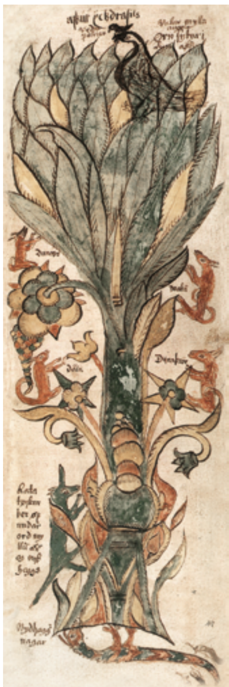
Иггдрасиль — исполинский ясени (или тис), символизировавший для скандинавов устройство вселенной.

Какую роль животные играли в жизни славян