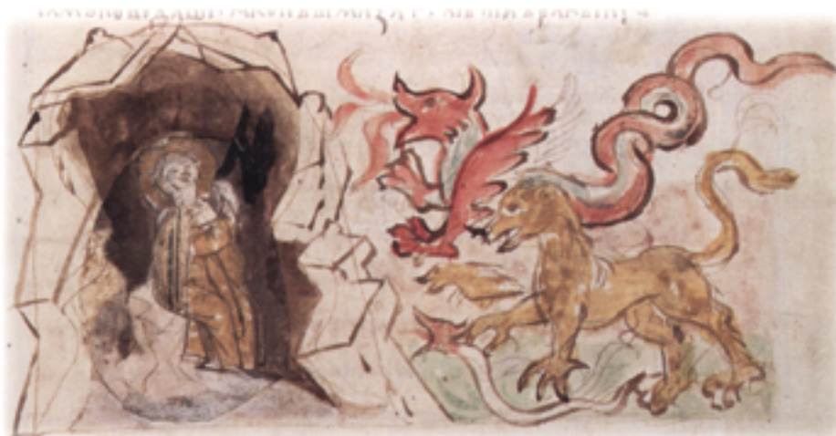
РАДЗИВИЛОВСКАЯ ЛЕТОПИСЬ, КОНЕЦ XV ВЕКА.

Преподобный Исаакий, затворник Печерского монастыря (XI век), крестным знаменем изгнал бесов в образе змей, диких зверей и тварей.