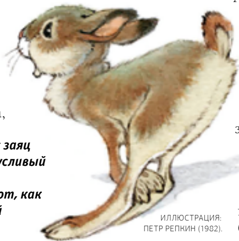
ИЛЛЮСТРАЦИЯ: ПЕТР РЕПКИН (1982).

— Они тоже, в основном, авторского происхождения и пришли в фольклор из древнерусской письменности, а та, в свою очередь, во многом восходит к византийской традиции. Например, птицы, живущие в раю: Сирин, Алконост, Гамаюн... Через ту же Византию добиралась до нас и античная традиция. Так что знали на Руси и китовраса (кентавра), и единорога, и левиафана... Мало того, бытовало еще