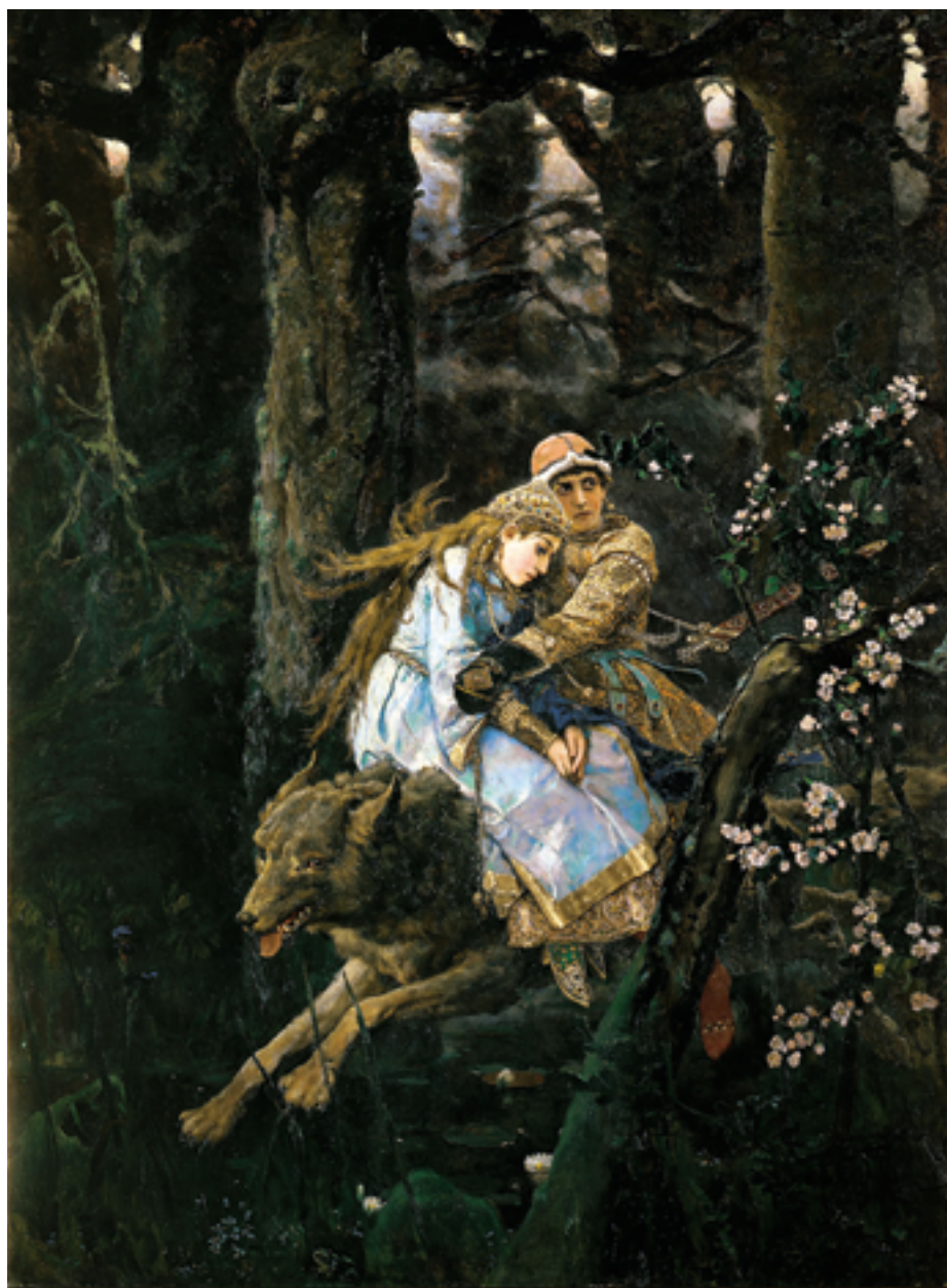
ВИКТОР ВАСНЕЦОВ. «ИВАН-ЦАРЕВИЧ И СЕРЫЙ ВОЛК» (1889).

— Как гласит легенда, Пушкин, будучи в ссылке в Михайловском,