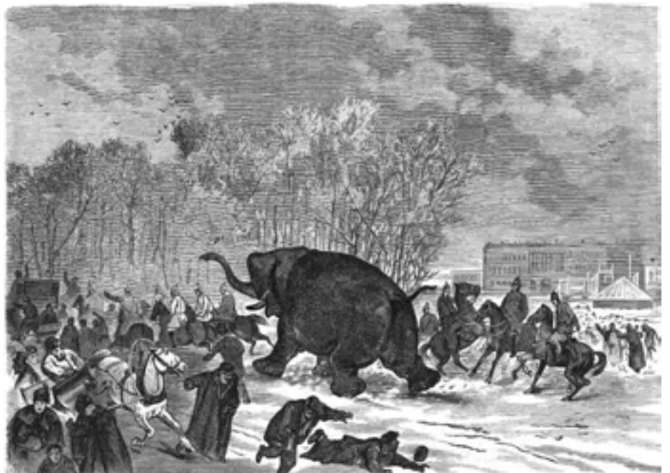
О бегстве слона из балагана Роста поведала «Всемирная иллюстрация» (1874). Все попадавшиеся на его пути прохожие разбежались, а потом бежали следом в толпе зевак. Часа через два слона изловили.

Кстати, этот слон был не первым, отправленным в Северную