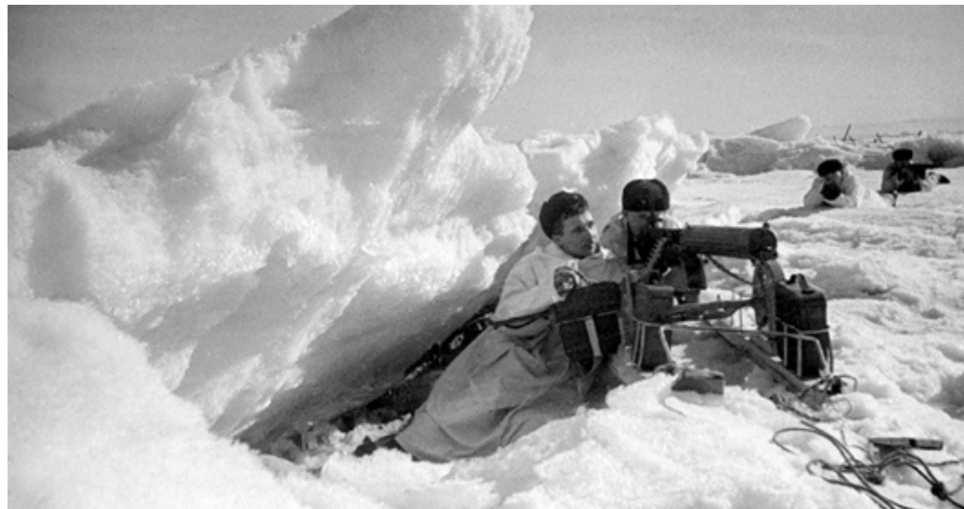
КРАСНОАРМЕЙЦЫ НА ЛЬДУ ФИНСКОГО ЗАЛИВА. 1942 ГОД.