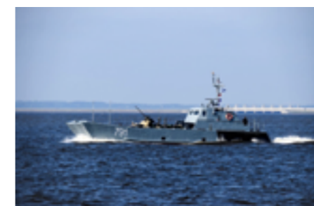
Современный десантный катер Д-1441 (бортовой № 791) отныне носит имя «Алексей Баринов».

«Главный удар мы нанесли в 3.30 (финское время. — Ред.)... В момент атаки разразилась сильная снежная пурга, которая длилась весь день, покрыв войска слоем снега». Минометно-артиллерийский огонь обрушился на остров сразу с запада, севера и с востока, а пурга не дала прибыть нашим самолетам, что и лишило бариновцев всех шансов удержать Гогланд.