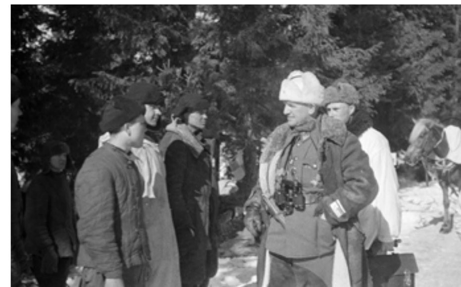
Генерал Пиярви допрашивает пленных «бариновцев». 29 марта 1942 года.

Эндшпиль. Черные продолжают и выигрывают «Солдаты и лошади были в белых маскхалатах, но враг заметил движение... и послал в Кронштадт условный сигнал, который мы заперенговали». Это было днем 26 марта. Также Баринов доложил, что ночью финны наверняка пойдут в наступление. Ответ Кронштадта в 01:00 вдохновлял: вышлем авиацию, «держитесь... мужественно и стойко».