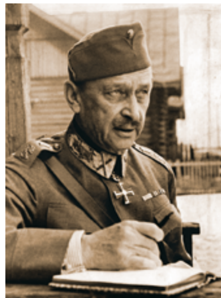
Фельдмаршал Карл Густав Эмиль Маннергейм, 74 года

Три месяца противостояния советского полковника и финского фельдмаршала