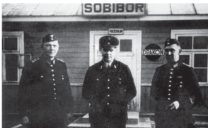
Начальство концлагеря «Собибор»