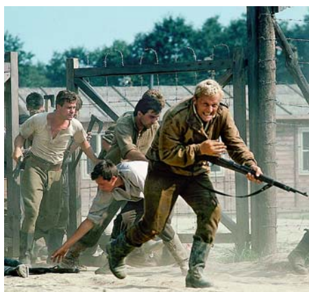
КАДР ИЗ ФИЛЬМА «ПОБЕГ ИЗ СОБИБОРА» (1987).

В британском фильме 1987 года главную роль сыграл Рутгер Хауэр. Печерского на премьеру картины из Советского Союза не выпустили.