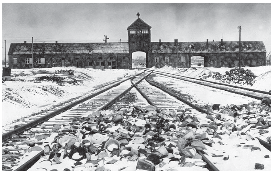
Концентрационный лагерь «Собибор», Польша, 1943 год