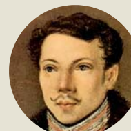
Александр Бестужев (Марлинский)

из-за уха торчали разбитые черепные кости») Котляревского доставили в Тифлис. В шкатулке он хранил с тех пор 40 фрагментов костей, извлеченных из его тела. Генералу было всего 30 лет. Дальше его ждала жизнь инвалида. За Котляревским ухаживала племянница. Чувствуя приближение смерти, он решил жениться на ней,