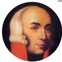
Павел Цицианов (1754–1806)

Русская артиллерия стреляла по ним картечью. Всего выпустили 30 голов скота, благодаря чему сильно проредили ряды противника.