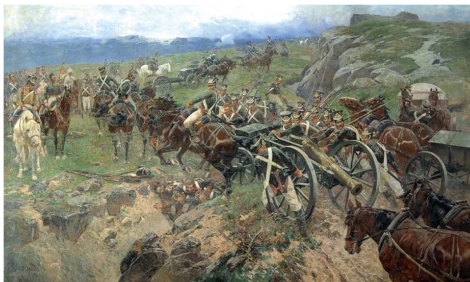
ФРАНЦ РУБО. «ЖИВОЙ МОСТ», (1897).

В батальоне находился проводник армянин Юзбаш, семья которого была обязана Карягину. В ночь на 29 июня он скрытно вывел всех русских с кургана (обоз оставили, раненых несли на носилках). Дерзким рейдом по горам русские совершили бросок к Шах-Булахскому замку. И едва на рас-