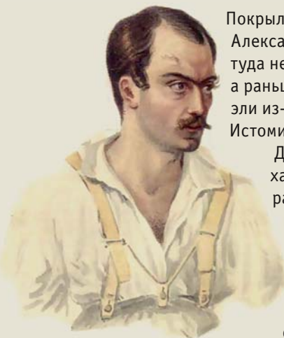
АЛЕКСАНДР ЯКУБОВИЧ. АКВАРЕЛЬ НИКОЛАЯ БЕСТУЖЕВА (1831).

Покрыв себя славой на Кавказе декабрист Александр Якубович. Но только сослан он был туда не за восстание на Сенатской площади, а раньше, за участие в знаменитой четверной дуэли из-за воспетой Пушкиным балерины Авдотьи Истоминой («Блистательна, полувоздушна...»).