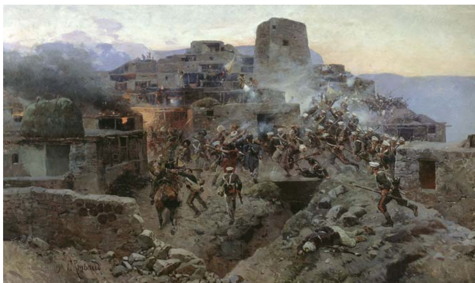
ОБРАЗОК РУССКОГО ХУДОЖНИКА А. ГИМРЫ (1832).

Взятие дагестанского аула Гимры в 1832 году продемонстрировало горцам, что русский солдат может пройти даже в такое место, которое считалось неприступным.