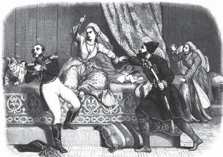
ГРАВЮРА ШАРЛЯ МИШЕЛЯ ЖОФФРУА (1845).

Спустя пять лет примерно так же погиб главнокомандующий русскими войсками на Кавказе, выросший в России грузинский князь Павел Цицианов. Его связывала давняя дружба с бакинским ханом Хусейном-Кули. В 1806 году тот обещал отдать Баку под русский контроль. Но во время церемонии передачи ключей от крепости, на которую Цицианов, дове-